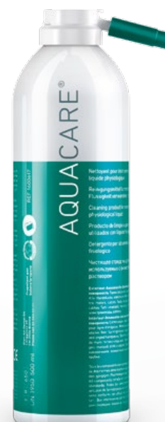
AQUACARE 500 ml, spray de limpieza Embalaje de 6 unidades REF. 1600617-006