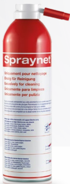
SPRAYNET 500 ml, spray de limpieza Embalaje de 6 unidades REF. 1600036-006