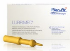
LUBRIMED Embalaje de 6 cartuchos REF. 1600037-006