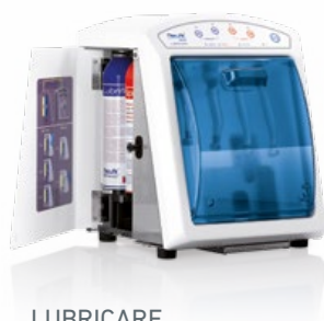
LUBRICARE Sistema de mantenimiento REF. 1600915-001