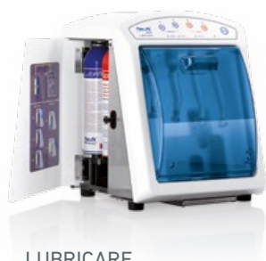
LUBRICARE Sistema de mantenimiento REF. 1600915-001