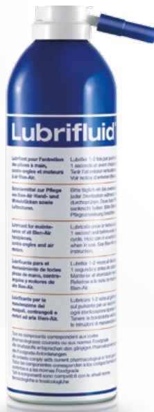
LUBRIFIUID 500 ml, lubricante Embalaje de 6 unidades REF. 1600064-006